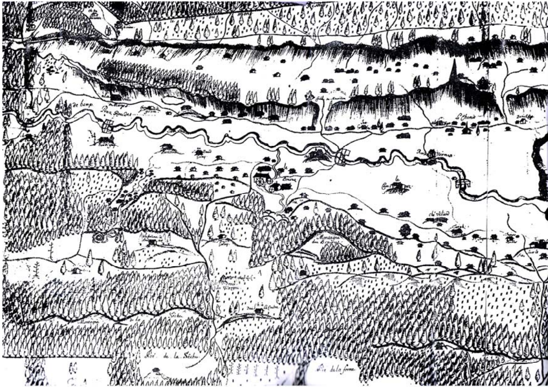
Carte Vallotton dite de Yale, vers 1710, un seul pont pour franchir l'Orbe au niveau du Brassus, le pont de Saut Pernet.