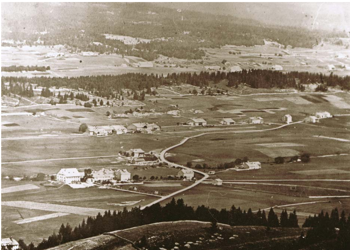
Le pont du Saut Pernet est visible au milieu de la photo dans le sens de la largeur, au tiers du bas dans le sens de la hauteur.