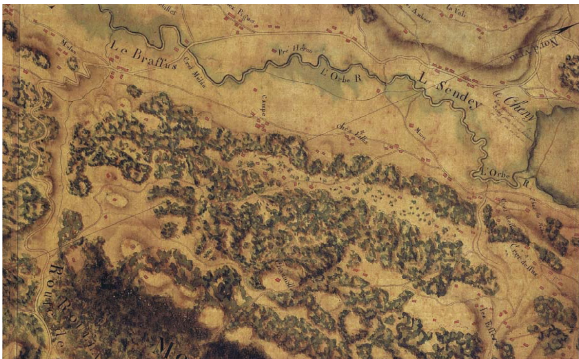
Carte IGN de 1785, d'une précision remarquable. Le pont du Saut Pernet est parfaitement en place.