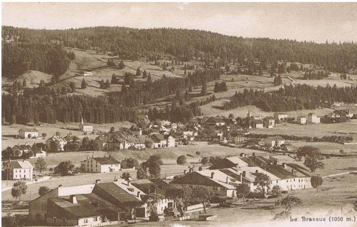
Piguet-Dessous. Au-delà, à droite, Chez Jacob. Le pont est juste après.