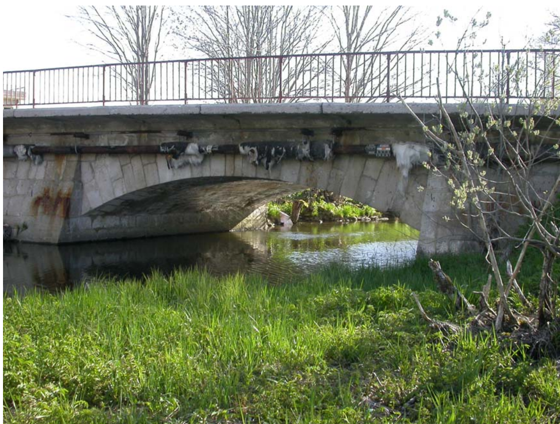
Le pont du Saut Pernet, refait on ne sait à quelle époque, probablement au début du XXe siècle, est très certainement l'un des deux à trois plus beaux ouvrages de ce type à la Vallée.